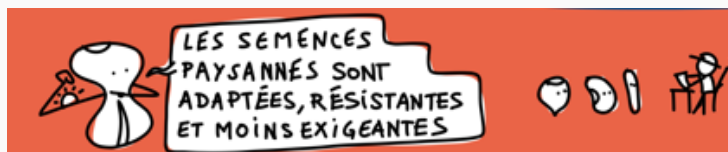
Programa de agroecología en el Sahel: seminarios web sobre las semillas campesinas (SC)